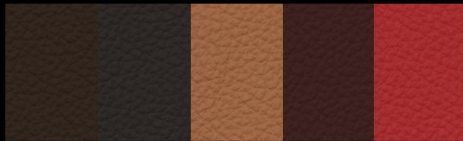
Chocolate Tizón New Cognac Burdeos Rosso