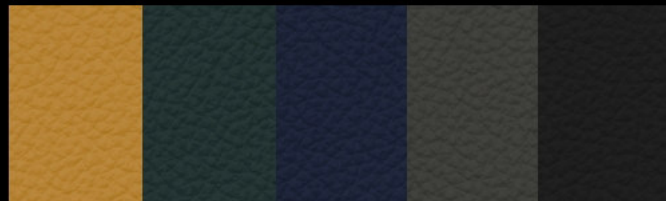
M ostaza Pavone Blue M ouse Nero