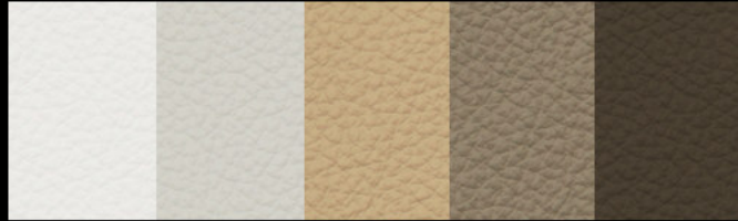
Blanco Ártico Caffelatte M astice Fango